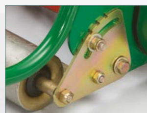
Réglage précis de la hauteur de coupe par un système simple d'usage.