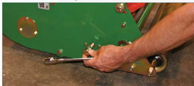
Desserrer les vis et faire glisser la cassette