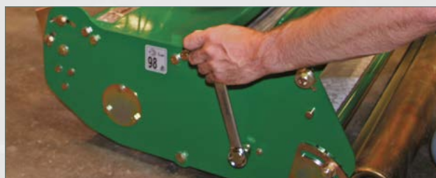
Serrer les boulons de fixation