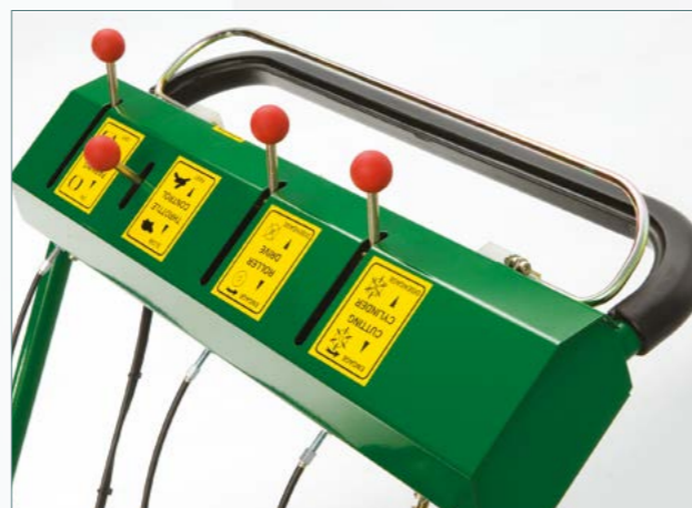
Commandes ergonomiques et faciles à utiliser.