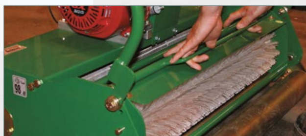
Insérer une nouvelle cassette sur l'unité avant