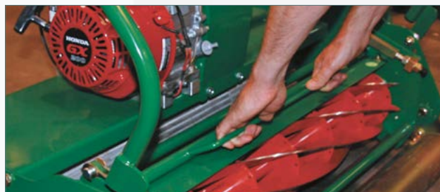
Extraire la cassette