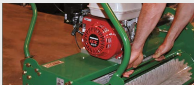
Extraction de la cassette inférieure